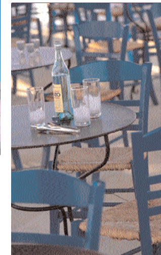
Klar: Ouzo am Hafenbecken