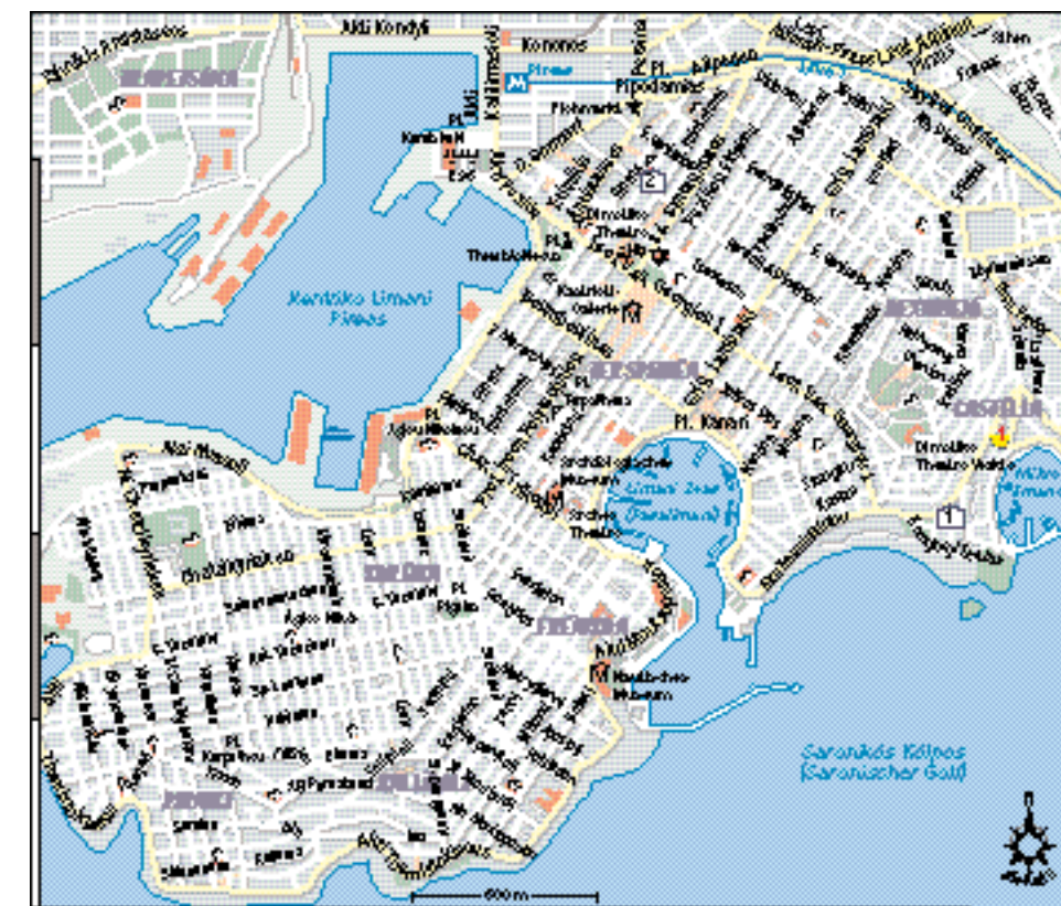
Höhe Restaurant-Tipp Kreuzfahrt-Terminal

Flüge oneway ab 49 €, z. B. mit dba oder Aegean Airlines.