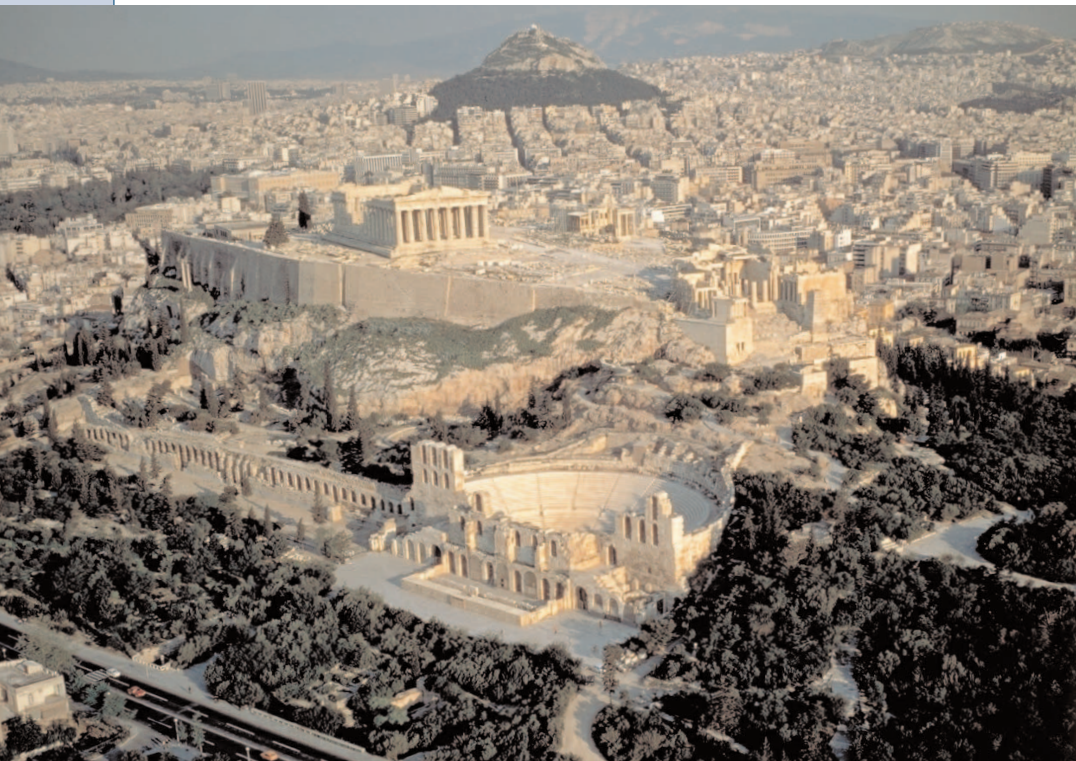
Erhaben: Blick auf Akropolis, Odeon und den Berg Lykavittos

Tipps für alle, deren Kreuzfahrt in Piräus beginnt oder endet. Und die besten Erlebnisadressen für einen Bummel auf eigene Faust.