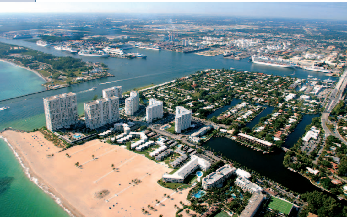
Fort Lauderdale: Liegt nur einen Sprung vom Kreuzfahrthafen Port Everglades

Was darf es sein: Krokodile beobachten in den Everglades oder Villen-Spotting am Kanal? Tipps für einen Tag in Fort Lauderdale.