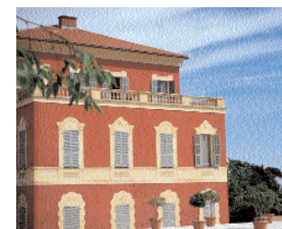
Matisse-Museum: Ein Muss

Tägl. Flüge von 5 deutschen Städten nach Nizza mit dba (oneway ab 25 €) zu angenehmen Abflugzeiten. www.flydba.com Infos zu Transfers unter www.nice.aeroport.fr