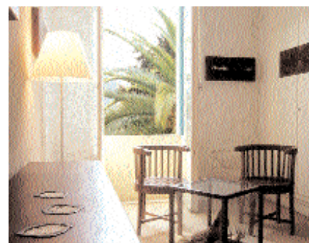
„Windsor“: Kunstwerk in Nizza

11 Tische, 22 unbequeme Hocker und keine 5 m 2 Küche. Man isst Niçoiser Spezialitäten wie frittierte Zucchini Blüten, gefüllte Sardinen (Sardines farçis), Würst mit Linsen oder Stockfisch (Vorsicht, riecht