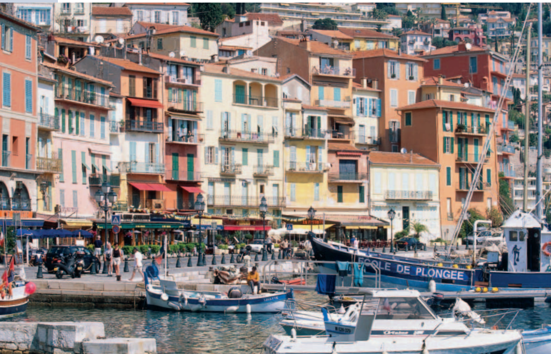
Villefranche: Wunderschönes Hafenstädtchen mit mittelalterlichen Gassen

Bei Cruises an der Côte d'Azur legt man meist in Villefranche an. Ein reizendes Städtchen – und um die Ecke lockt Nizzas Altstadt.