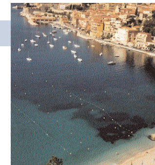
Strand: 5 Min. vom Terminal

MAMAC für moderne und zeitgenössische Kunst zeigt Avantgarde, Pop-Art und Abstraktes von Niki de Saint Phalle, Yves Klein und Warhol. Di–So. www.villefranche-sur-mer.com