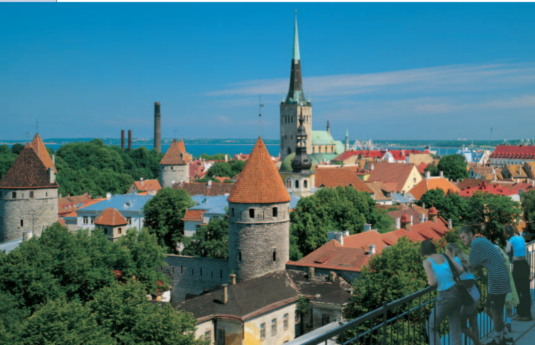
Blick herab vom Domberg auf die Tallinner Stadtmauer und die Heiliggeistkirche

Lust auf Schauen und Schlemmen im Licht des Nordens? Tallinns Altstadt ist ein mittelalterliches Kleinod wie aus einem Guss.