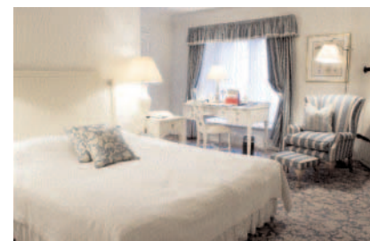
„Schlossle Hotel“: Elegante Bleibe

Im „ Kuldse Notsu Körts “, was übersetzt soviel wie „kleines Schweinchen“ bedeutet, gibt es überwiegend estnische Gerichte. Das gemütliche Kellerrestaurant gehört zum Edelhôtel „St. Petersburg“. Unbedingt das hausgemachte Brot probieren! Interieur im Stil eines alten estnischen Landgasthauses, mit Kamin, Wagenrädern und Bauern-